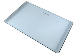
Planche de découpe en verre 8633 300